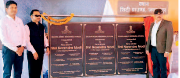
लगभग चार करोड़ पचास लाख की लागत से ये एक-एक विद्यालय बस्तर के दूरस्थ विकासखंड लोहांडीगुड़ा, बास्तानार और दरभा में स्थापित किए गए हैं जिनका उद्देश्य क्षेत्र के अनुसूचित जनजाति के छात्रों को उच्च गुणवत्ता वाली, आवासीय शिक्षा प्रदान करना है।