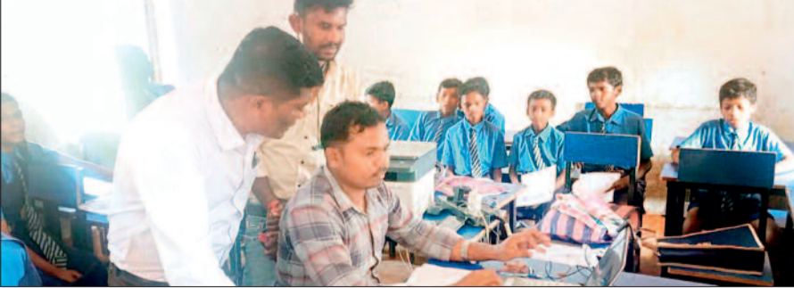
है, छात्रों के लिए वरदान साबित होगी। यह एक डिजिटल लॉकर के रूप में कार्य करती है, जहां बच्चों के जन्म से लेकर उच्च शिक्षा तक के सभी शैक्षणिक रिकॉर्ड सुरक्षित रहते हैं। यह सुविधा छात्रों को प्रवेश या नौकरी के लिए कागजी दस्तावेजों की आवश्यकता से मुक्ति दिलाएगी। साथ ही यह प्रवेश प्रक्रियाओं को सुगम बनाती है और छात्रवृत्ति तथा अन्य सरकारी योजनाओं का लाभ सीधे और पारदर्शी तरीके से पहुंचाने में सहायक सिद्ध होगी।