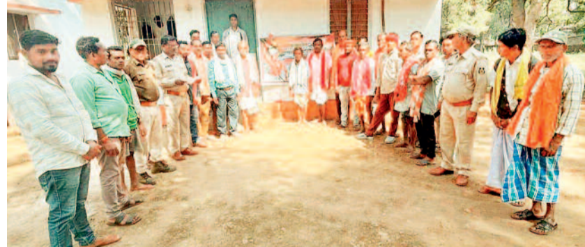
जगदलपुर। बस्तर वन मंडल अंतर्गत समस्त वन प्रबंधन समितियों एवं स्कूली बच्चों को जनजाति गौरव दिवस के महत्त्व के बारे में जानकारी दी गई। साथ ही साथ मुख्यमंत्री द्वारा जनता को संबोधित संदेश मुख्यमंत्री की पाती का वाचन भी किया गया।